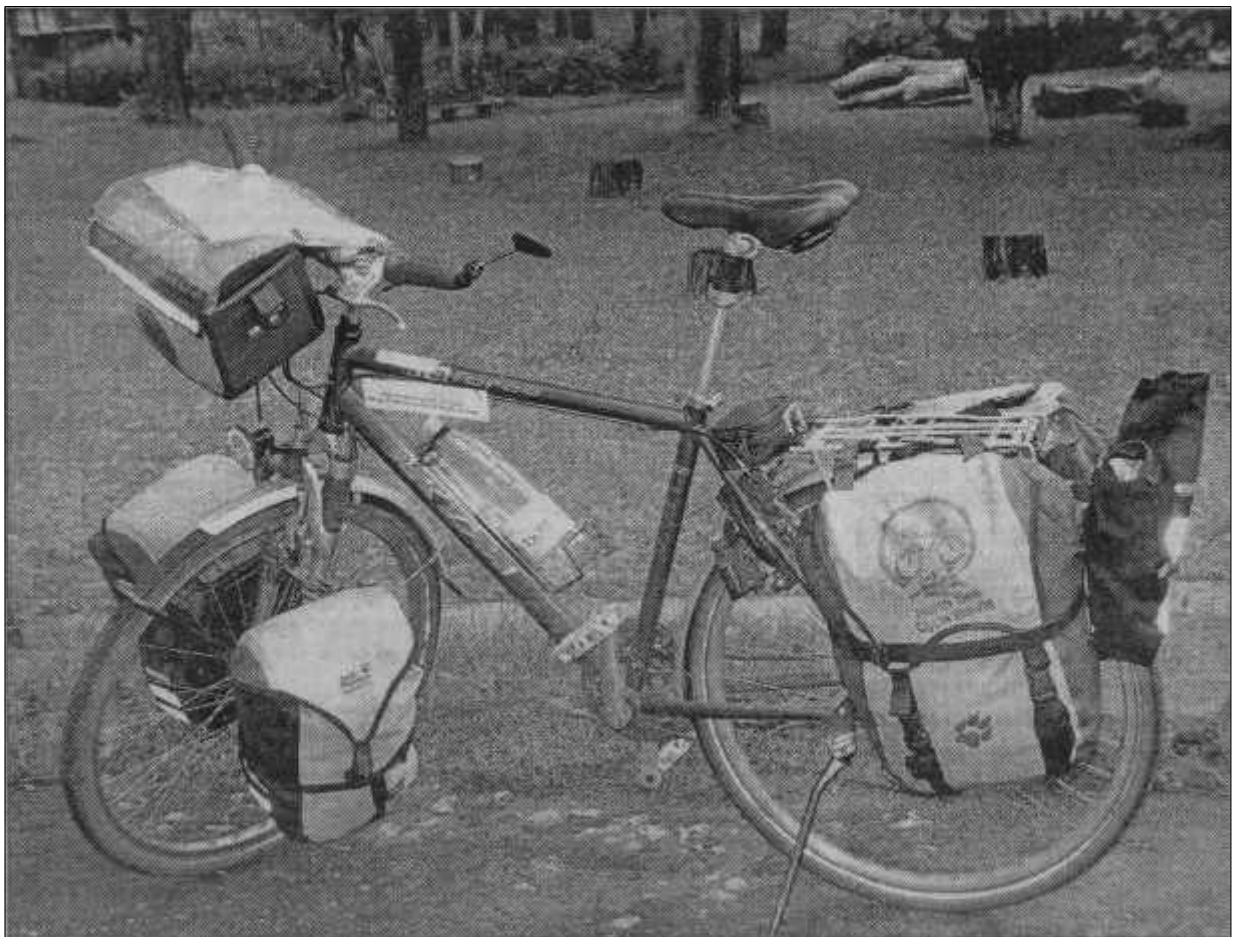
Šādi izskatās ideāls velobraucēja ekipējums, kas pieder kādam vācietim